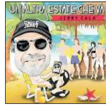
Jerry Calà in concert show Una vita da libidine il 12/07 al CC Lazio per la Festa dell'estate 2018. Sopra la copertina del nuovosingolo, a lato Calà al Piper ad ottobre 2017

Un concerto spettacolo il 12 luglio al Canottieri Lazio per festeggiare uno stile di vita e il nuovo singolo